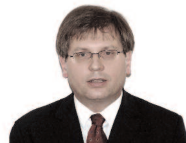
Fabiny Tamás püspök Északi Egyházkerület

Ezt a pedagógusnap i tünődést és a tanárok köszöntését egy olyan igével zárom, amelyet néhány hete a Deák téri gimnáziumban idéztem az evangélikus iskolák alkotó és kutató tanárainak második konferenciáján. A Károli-fordítás szerint így szól az apostoli biztatás: „...a ti hitetek mellé ragasszatok jó cselekedetet, a jó cselekedet mellé tudományt.” (2Pt 1,5)