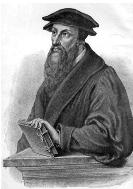
Kálvin János portréja

Kálvin a Római levélhez írott kommentárjának ( A rómaiakhoz írt levél magyarázata , 1539) előszavaként Grynaeusnak címzett.