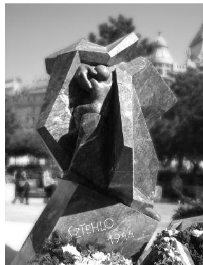
Sztehlo Deák téri szobra

veződött az öt hónapos, bentlakásos népfőiskola Nagytarcsán” – olvassuk Koren Emil nél.