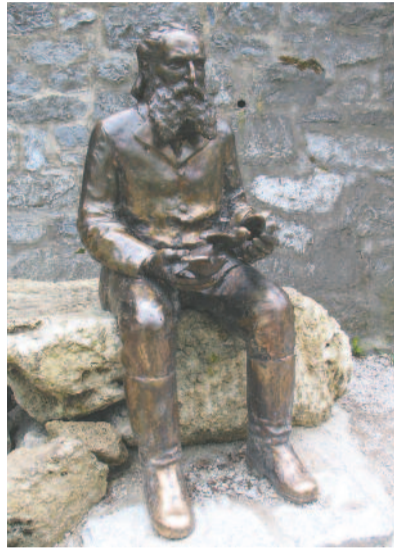
Herman Ottó szobra a Palotaszálló alatti függőkertben, Lillafüreden

Kutatásait Herman a Duna–Tisza közén, a Vajdaságban, Erdélyben, az Alföldön, Felvidéken és a Dunántúlon folytatta. Az összegyűjtött anyagot a bácskai Doroszlón rendszerezte. Az 1875-ben, 77-ben és 78-ban megjelent, háromkötetes, Magyarország pókfajánája című műve meghozta számára a világhírt. A könyvet egyébként saját kezűleg illusztrálta. Érdekesség, hogy a hiányzó magyar szaknyelvet a takácsipar és a szövés-fonás gyönyörű magyar kifejezéseivel pótolta.