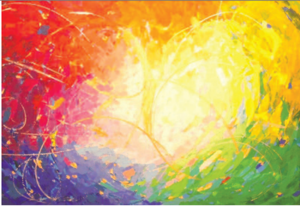
CHIARA LUBICH: SZENTLÉLEK